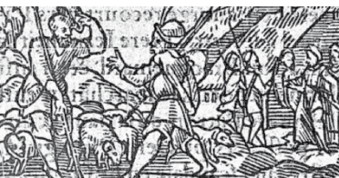
Gravure sur bois illustrant le quart-livre « Les moutons de Panurge »

Une fausse « mère porteuse », vraie mythomane, est interviewée « en exclusivité » par Le Parisien , qui publie cet entretien samedi 9 mars. Quelle aubaine, un week-end de surcroît, pour les autres médias ! Le Landernau de la presse se précipite toutes affaires cessantes : chaînes d'information en continu, presse régionale, médias nationaux courent après leur confrère du matin. La planète média scintille. Jusqu'à ce qu'une journaliste plus consciencieuse, interrogeant la famille, découvre la