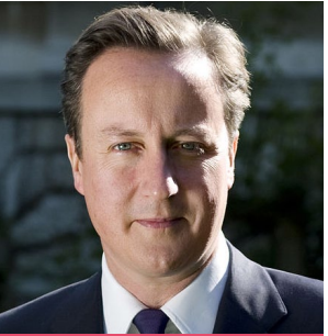
David Cameron, Premier ministre du Royaume-Uni

Près de deux ans après la constitution d'une commission d'enquête sur les écoutes téléphoniques de journalistes de la presse Murdoch, quatre mois après la publication du rapport du juge Leveson sur la réforme de la régulation de la presse, les trois grands partis politiques britanniques sont enfin parvenus à un accord sur le nouveau régime de la régulation de la presse. La nouvelle institution sera créée par « Charte Royale ». C'est une manière très britannique d'éviter de légiférer, ce qui serait à l'opposé des convictions du gouvernement conservateur. Ce genre de charte définit des organismes indépendants comme la BBC, la Banque d'Angleterre ou des universités. Elle sera « adossée » à deux textes de loi mais il faudra les deux tiers du Parlement pour la modifier.