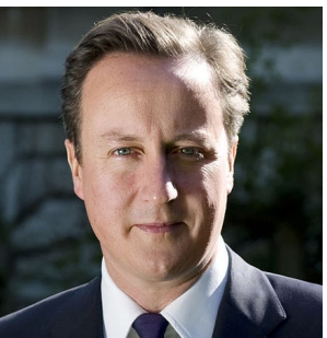
David Cameron, Premier ministre du Royaume-Uni

Près de deux ans après la constitution d'une commission d'enquête sur les écoutes téléphoniques de journalistes de la presse Murdoch, quatre mois après la publication du rapport du juge Leveson sur la réforme de la régulation de la presse, les trois grands partis politiques britanniques sont enfin parvenus à un accord sur le nouveau régime de la régulation de la presse. La nouvelle institution sera créée par « Charte Royale ». C'est une manière très britannique d'éviter de légiférer, ce qui serait à l'opposé des convictions du gouvernement conservateur. Ce genre de charte définit des organismes indépendants comme la BBC, la Banque d'Angleterre ou des universités. Elle sera « adossée » à deux textes de loi mais il faudra les deux tiers du Parlement pour la modifier.